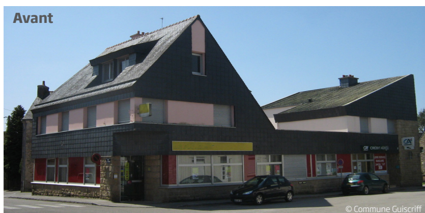
Une architecture hybride mêlant typologie traditionnelle et lignes modernes.

Le déménagement de la poste qui occupait un vaste immeuble communal au contact de la mairie offre une opportunité pour satisfaire à cette exigence de proximité.