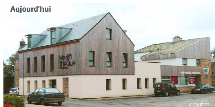
Une transformation contemporaine plus cohérente avec l'habitat ancien du bourg.

Le nouvel équipement doit offrir des espaces divers, accessibles, confortables, propices aux échanges et à la convivialité. Au-delà de la médiathèque, il doit permettre le déroulement de multiples activités (animation cybercommune, exposition, réunion, conférence, formation professionnelle, cours de musique, animation enfant avec la CAF, etc.).