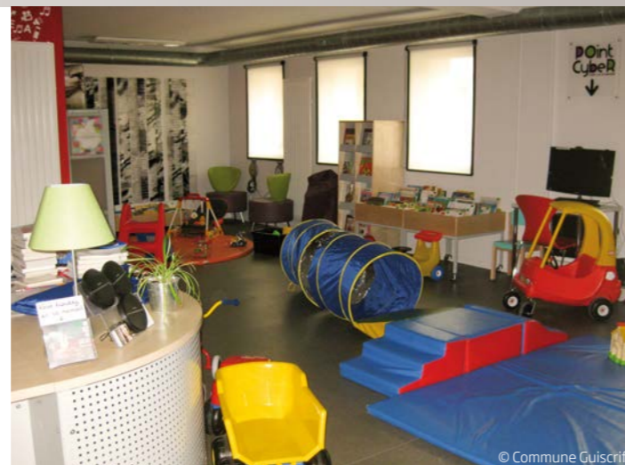
Le choix d'un mobilier facile à déplacer permet de jouer sur l'organisation des espaces comme ici où les rayonnages laissent la place à l'accueil des tous petits dans la partie ludothèque.