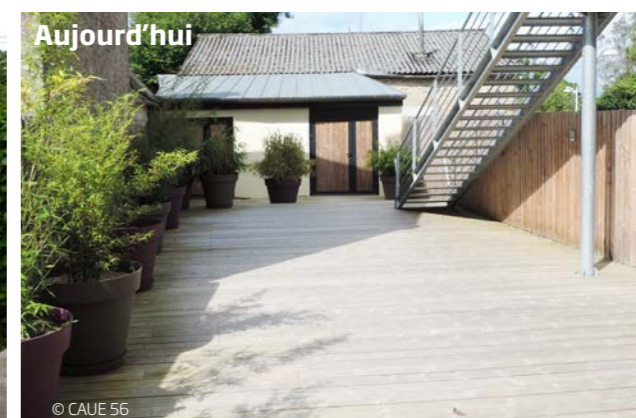
Création d'un patio de lecture dans le prolongement de la médiathèque.

L'architecture intérieure privilégie la simplicité et la convivialité. L'organisation interne du bâtiment a été peu modifiée, il faut en revanche souligner l'importance des travaux de renfort de structure (planchers et fondations) pour permettre l'accueil du public. Pour des raisons de coût et de qualité des espaces (hauteur sous plafond), les gaines de la VMC et les IPN sont laissés apparents. Un artiste peintre a participé au choix de couleurs pour les murs. Une graphiste locale a proposé une signalétique spécifique.