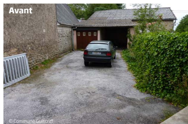
Anciens parkings et garages de la poste.

bois agrémentée de plantations et isolée de la rue par la pose de panneaux bois. Le coin lecture ouvre sur cet espace auquel il est directement relié.